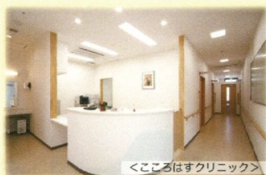
<こころはすクリニック>

併設クリニック・系列病院や協力病院との医療連携により安心した生活を送ることができます。経験豊かな看護師・介護士が24時間サポートし、緊急時も速やかな対応を致します。